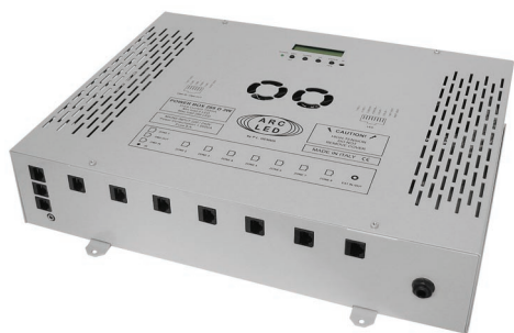
POWER BOX 288 D 1W CODE: PBD081