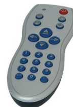
Optional remote control

POWER RACK 288 1W and POWER RACK 288 3W have a compact 19"x2u rack mountable size. They control the whole ARC LED color change range through a DMX signal in stand alone modality, or through an IR remote control. The POWER RACK 288 have a LCD display and 4 multifunction buttons which give the possibility to visualize and set all its functions: management of 8 zones of 36 leds, possibility of programming up to 8 programs with 20 scenes, independent execution time for each scene from 1 sec to more than 4 hours, wave effect, IR remote control. The DMX connection is made through both RJ11 and XLR3 connectors.