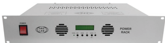
POWER RACK 288 1W CODE: PBR081

POWER BOX 288 D 1W and POWER BOX 288 D 3W control the whole ARC LED color change range through a DMX signal in stand alone modality, or through an IR remote control. The POWER BOX 288 D have a LCD display and 4 multifunction buttons which give the possibility to visualize and set all its functions: management of 8 zones of 36 leds, possibility of programming up to 8 programs with 20 scenes, independent execution time for each scene from 1 sec to more than 4 hours, wave effect, IR remote control. The DMX connection is made through both RJ11 and XLR3 connectors.